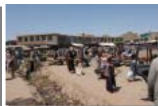
【写真左:停電ばかりの市内の発電機】 【写真右:市内の喧騒】