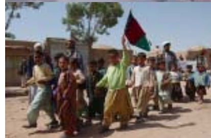
【写真上:建国記念日の学童の行進】

しかし実際の生活レベルは、正に終戦後の様相で水道、電気共に一日の半分以上が断水・停電である。一步都市を離れると、電気がなく、数世紀前の生活に戻った様な状態になる。勿論、都市間を繋ぐ電話もなく、海外通話は、衛星電話でしか出来ない。これらの生活面については別途報告書を NGO の NICCO と共同で準備する予定なので、インフラ整備・道路整備に関わる説明に的を絞って以下要約したい。