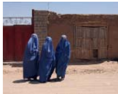
【写真右:ブルカの女性】

当日の説明会の席上、社団法人日本国際民間協力会の小野理事長から「現地の取水と道路の悪さが NGO 活動の大きな妨げになっている。」との説明があり、「日本政府に早急に対応してほしい。」との要望があった。それらの背景もあり、建設機械の専門家という立場から、社団法人日本国際民間協力会と協力してイラン経由で当地ヘラートに入った。当地ヘラートは、首都カブールから車で 2 日の距離にある当国第三の都市であり、イラン国境に接した西部地域のヘラート州最大の都市である。