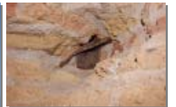
【写真上: 市内でわずかに残っているタリバンとの戦闘による弾痕】