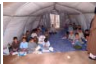
【写真上:「学校に戻ろう」キャンペーンとテント教室で学ぶ児童】

の機関は、調査に入ることさえしていないのが現状である。NGO/NPOが活動している以上、安全であることは実証済みだが、当ヘラートは、約10日間の調査の結果から、「極めて静かな街で、復興が待たれてい